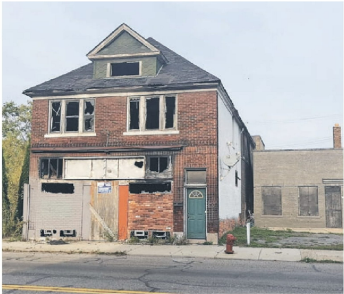
► Una casa abandonada en Detroit, Michigan.