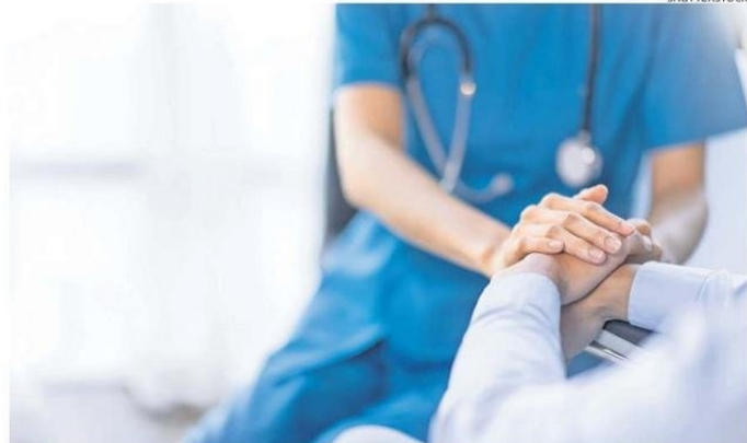
DORMIR LO SUFICIENTE DEBERÍA SER PARTE DEL TRATAMIENTO MÉDICO DE RECUPERACIÓN.

Los investigadores utilizaron primero modelos de ratón para descubrir este fenómeno; indujeron infartos en la mitad de los ratones y realizaron análisis celulares y de imágenes de alta resolución, además de utilizar dispositivos electroencefalográficos inalámbricos implantables para registrar las señales eléctricas de sus cerebros y analizar los patrones de sueño.