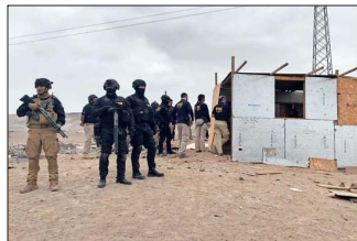
Para muchos expertos, este año fue la consolidación del crimen organizado incluyendo trata de personas explotadas en delitos sexuales. En la imagen, personal de la PDI en un operativo contra el Tren de Aragua.