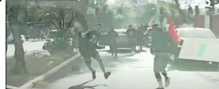
Un ataque recibió ayer un vehículo de un equipo de Canal 13. Por el momento hay un detenido.

na el resto de familias que iban acompañando a sus deudos, resaltando que "dado que no existe aún aprobación del proyecto de ley de los denominados funerales de alto riesgo, no tenemos fa-