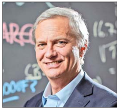
José Antonio Kast (P. Republicano).