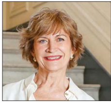
Evelyn Matthei , alcaldesa de Providencia.

De acuerdo con la encuesta realizada por el Panel Ciudadano de la Universidad del Desarrollo (UDD), los escenarios para las elecciones presidenciales de 2025 cambiaron tras los comicios municipales del fin de semana pasado. Sin embargo, lo que no se altera es que la alcaldesa de Providencia y carta presidencial de Chile Vamos, Evelyn Matthei, seguiría liderando entre las figuras políticas con mayor intención de voto.