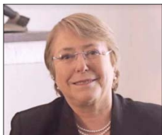
Michelle Bachelet , expresidenta.

El alcalde, sin embargo, también ha señalado que por ahora su objetivo no es llegar a La Moneda. En entrevista con Canal 13 aseguró: "En tres años más no tengo idea, ahora no. Yo tengo cuatro años más de trabajo por Maipú". A ello agregó que "no lo descarto, tengo 34 años, me