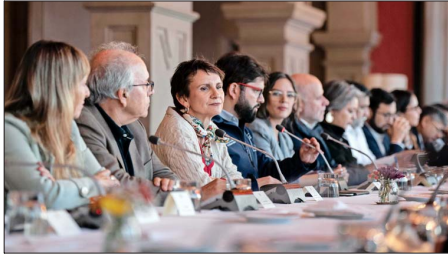
Cónclave en Cerro Castillo se concreta en medio de una nueva polémica que remeace al Ejecutivo.

Creced dudas y reparos sobre la demora en la salida del exfuncionario si el Gobierno supo dos días antes que la policía realizaba diligencias directas por denuncia de delitos sexuales.