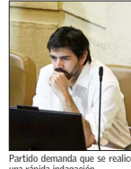
Partido demanda que se realice una rápida indagación.

Oposición discute si avanzar o no en una acusación constitucional contra la jefa de gabinete por el manejo del caso o esperar el ajuste ministerial.