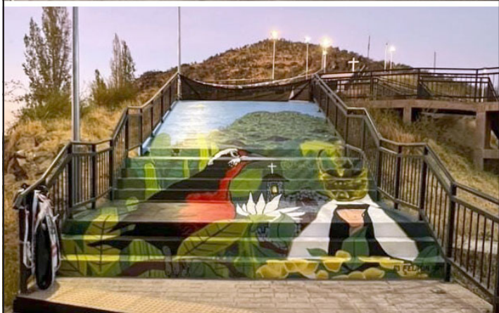
El antes y el después de la escalera con rampa que fue intervenida por el muralista.