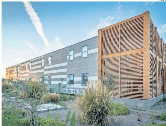
EL PROYECTO CONTEMPLA DOS EDIFICIOS Y 112 HABITACIONES, QUE SUMAN 4.000 METROS CUADRADOS.

Desde Tecno Fast, la empresa que realiza las obras, explicaron que la principal ventaja de la construcción con módulos es su velocidad, que permite un ahorro del 50% en los plazos. Adicionalmente, representa una solución sostenible que reduce el impacto ambiental, tanto acústico, del aire, co-