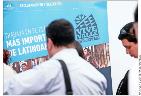
Los trabajadores entre 15 y 29 años son el segundo grupo etario con una mayor tasa de empleo precario.

Por otro lado, la disminución de los jóvenes que no estudian ni trabajan se ha recortado princi-