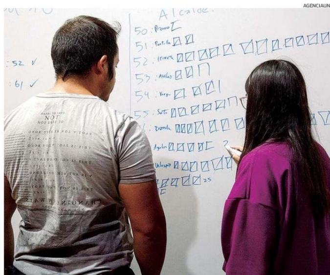
EN CUATRO DE LAS NUEVE COMUNAS DE LA REGIÓN ASUMIRÁ UN NUEVO ALCALDE EN DICIEMBRE.

fundo en la comuna y eso se reflejó en las urnas”, dijo. ☾