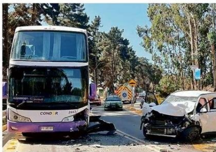
EL CHOQUE OCURRIÓ LA TARDE DEL DOMINGO EN EL QUISCO.

La colisión, de gran magnitud, causó que la lactante saliera eyectada del vehículo, cayendo a varios