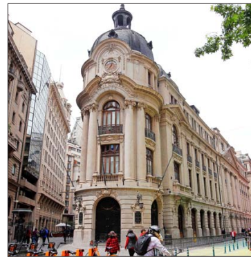
Tras subir durante seis sesiones consecutivas, el IPSA cayó 0,28% y el dólar cedió solo $3,9, a $945,1.

Son "resultados positivos para los mercados", señala Pardo, de XP Investments. No obstante, "no esperaríamos movimientos muy significativos, pues se esperaba que la centroderecha tuviera un mejor desempeño frente a la coalición del gobierno", indicó. En