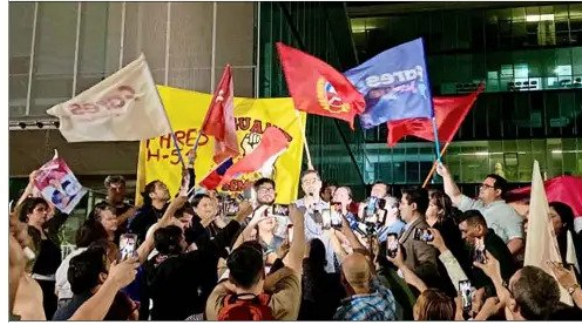
Tras ganar, Jadue abordó ciertos desafíos, como el proceso judicial que sigue Daniel Jadue.

lismo, pero principalmente para el Partido Comunista. Primero, porque mantiene el control de una comuna que ganó hace 12 años y que se ha convertido, pese a su pequeño tamaño, en un referente a nivel nacional. Además, se refrenda, se valida la obra de Daniel Jadue, que pese a sus dificultades judiciales, sigue siendo un referente y una de las figuras mejor posicionadas del partido”.