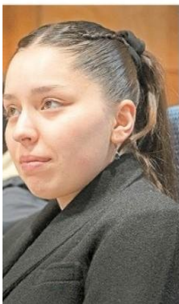
Estas son algunas de las estudiantes que realizan sus actividades

intolerancia a la lactosa en universitarios; relación entre ansiedad, composición corporal y control autonómico cardíaco en deportistas de combate; efectos del calafate sobre la memoria y el daño neuronal en ratones con Enfermedad de Alzheimer; relación entre vitamina D, depresión, ansiedad y composición corporal de expedicionarios antárticos; relación entre presión arterial sistólica y termorregulación en nadadores de aguas del Estrecho de Magallanes; determinación de prevalencia y asociación clínica en población magallánica de las dos mutaciones asociadas a cáncer de mama más frecuentes en Chile; relación entre especies bacteriales orales, precursores salivales y respuesta cardiovascular al ejercicio en personas mayores, y relación entre calidad de sueño, cantidad de horas de sueño y variabilidad en la luz estacional en adolescentes de Punta Arenas.