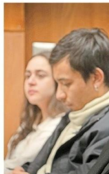
Parte de los asistentes al seminario, mayormente asistentes-docentes en el Cadi-Umag.

"Estamos desarrollando un kit diagnóstico más personalizado y eficiente", indicó.