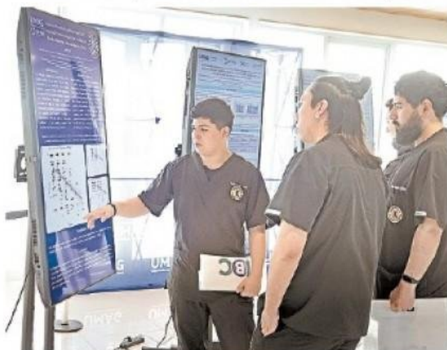
Investigación sobre el envejecimiento saludable y otras áreas de importancia sanitaria.

El seminario cerró con la expectativa de convertirse en una instancia anual que fomente la investigación en pregrado y fortalezca las áreas estratégicas del Cadi-Umag, centradas en el desarrollo humano y la salud.