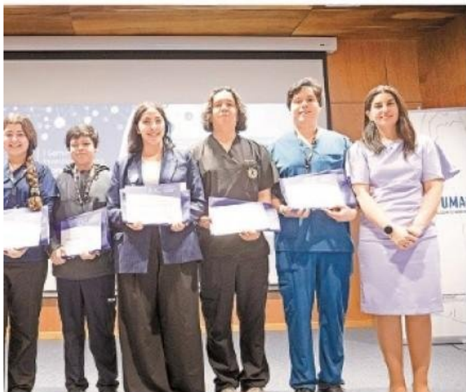
Se ganaron el Fondo Concursable de Apoyo para Estudiantes del Cadi-Umag que acción y/o innovación del área de la salud de la Región de Magallanes.