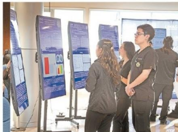
Destacaron los trabajos científicos y estudiantiles en biología molecular y bioinformática, cáncer, Covid prolongado, inmunología, bienestar infante juvenil, e