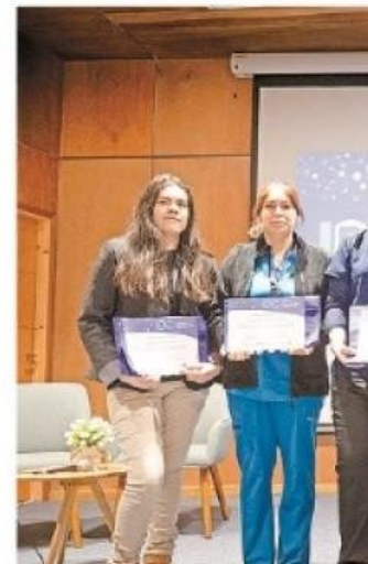
Estudiantes de las carreras de la Salud que financian proyectos vinculados a la investigación.