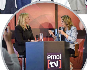
El Summit "Transformación Energética" de "El Mercurio" fue transmitido por las pantallas de Emol TV, y entre las dos jornadas el evento logró cerca de 1 millón de visualizaciones.