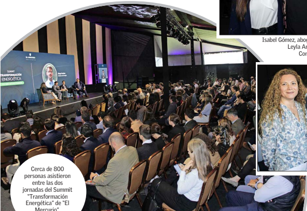
Cerca de 800 personas asistieron entre las dos jornadas del Summit "Transformación Energética" de "El Mercurio".