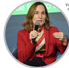
Valentina Durán, directora ejecutiva del Servicio de Evaluación Ambiental (SEA), participó en el panel "La necesidad de transmisión y la gestión de sus impactos".