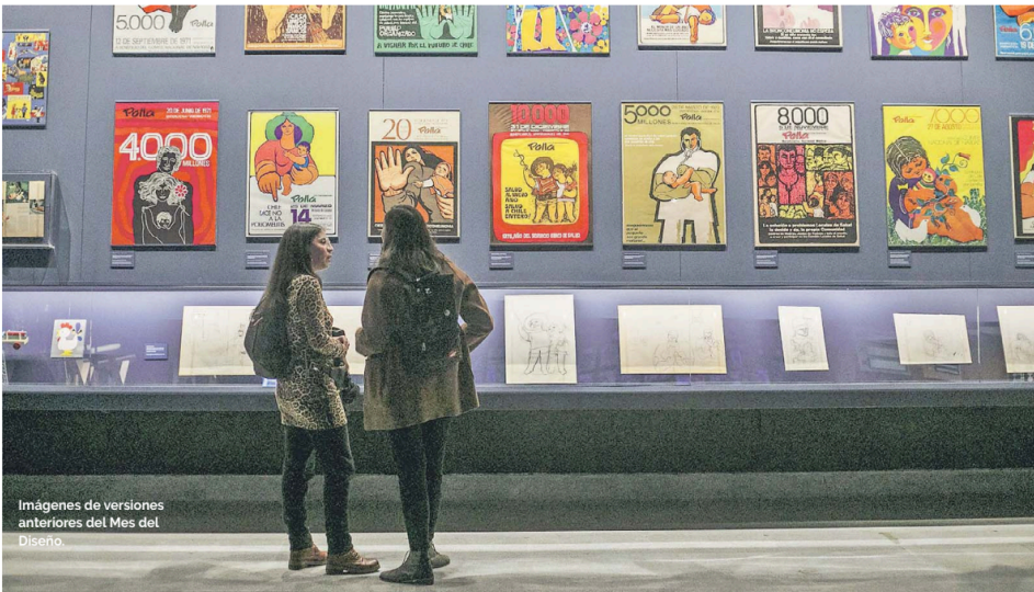
Imágenes de versiones anteriores del Mes del Diseño.