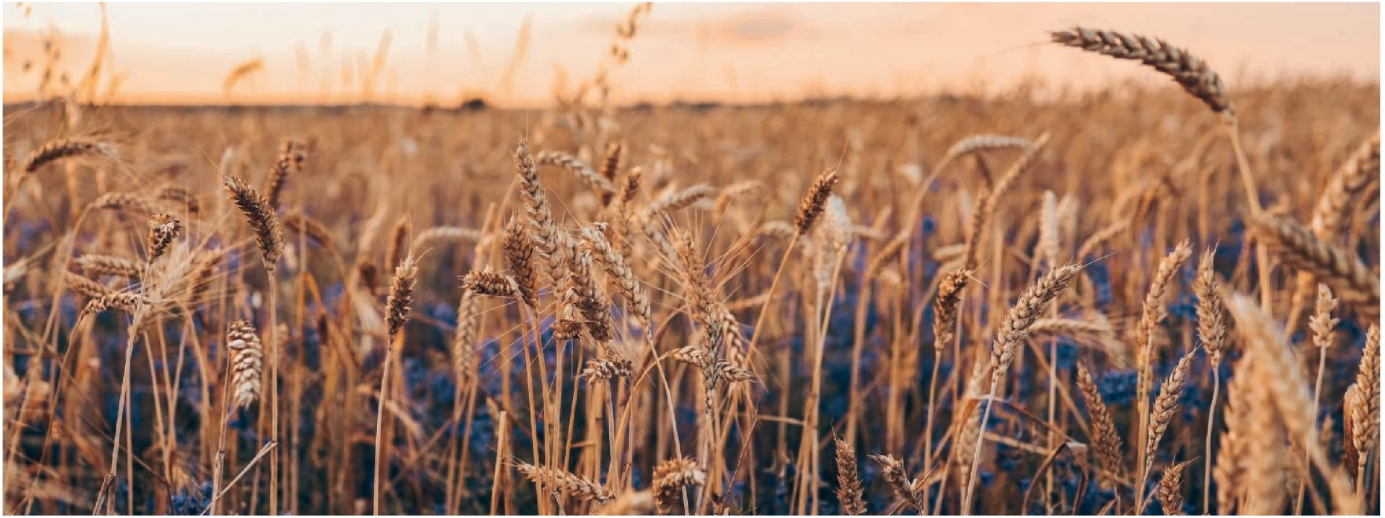
EL OBJETIVO DEL COMITÉ DEL TRIGO es evitar lo que ocurre en la actualidad, donde debido a la crisis de rentabilidad, cada vez hay menos productores cerealeros en Chile.