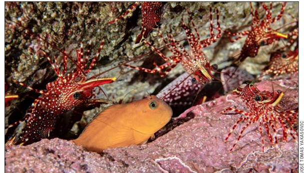
Camarones de roca rodean una borrachilla, una pequeña y abundante especie de pez que acostumbra a reposar sobre rocas que preferiblemente tengan grietas, para usarlas como escondite.