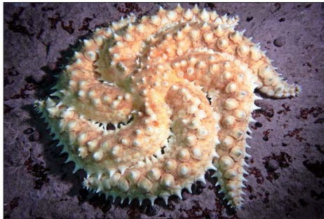
Una estrella de mar Júpiter en espiral. Esta es una de las estrellas de mar emblemáticas de los refugios marinos de Chile.

“También fue una instancia en la que pudimos juntar a buceado-