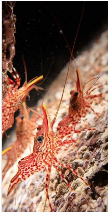
Ejemplares de camarones de roca, llamados así porque viven en rocas de agua poco profundas. Todas las fotos estarán disponibles próximamente en el sitio de la fundación: capitalazul.org .

Un grupo de 14 fotógrafos y fotógrafos chilenos, especialistas en fotografía y video submarino, se unieron para registrar material en refugios marinos ubicados en cinco caletas de la Región de Valparaíso, con el objetivo de sensibilizar a la población sobre la importancia de la conservación del mar.