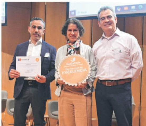
La compañía mide y gestiona su huella de carbono desde 2010, lo que ha sido reconocido por la autoridad ambiental.

La cadena de mejoramiento del hogar y construcción busca aliados para potenciar sus esfuerzos en la protección del medioambiente y mitigación de emisiones. Por ello, integra Pacto Global Chile, el grupo Líderes Empresariales por la Acción Climática (CLG-Chile) y Chile Green Building Council, entre otras organizaciones, junto con participar de iniciativas como "Pacto Chileno de los Plásticos" de Fundación Chile; y "La Hora del Planeta" de WWF Chile.