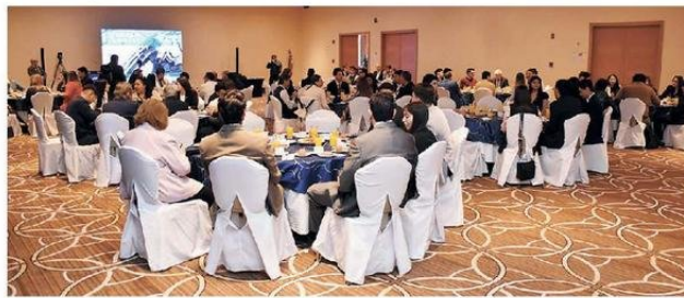
El desayuno se realizó en los salones de Casino y Hotel Antay.

Precisamente, una de las características distintivas del Coloquio Minero es que los estudiantes no son solo espectadores, sino que participan en toda la organización previa al evento y están en el centro del mismo. De hecho, varios