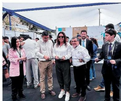
Durante la inauguración.