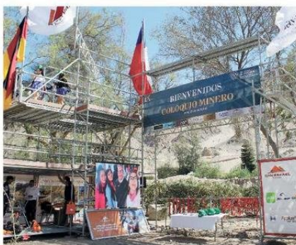
En el campus histórico de la Universidad de Atacama está la feria.