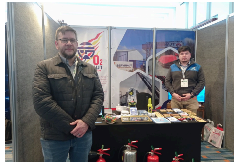
Servinaut fue una de las empresas participantes.

"La feria me parece espectacular. Es la segunda