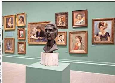
Este busto de Tótila Albert, que retrata a Gabriela Mistral en bronce, dialoga con un importante conjunto de retratos de diversos autores.

patrimonio en Chile. Entonces, nosotros establecemos alianzas con privados para difundir sus obras y llevarlas a un conocimiento más amplio de la población, mientras contribuimos también a la puesta en valor de estos acervos. Nuestras alianzas van más