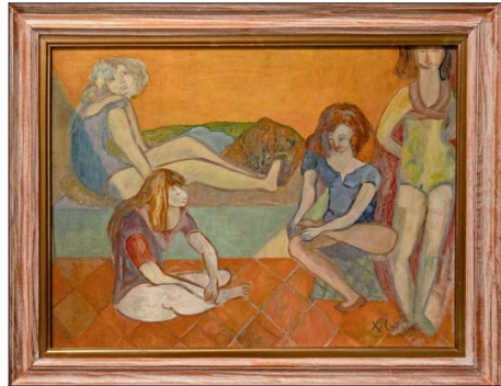
"Bailarinas", un óleo sobre tela de Ximena Cristi, es la obra más contemporánea del conjunto que se expone en la Pinacoteca UC.