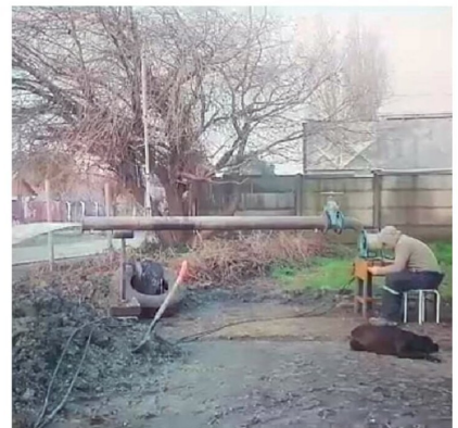
LAS FAMILIAS CUENTAN con el terreno para construir sus viviendas pero problemas técnicos y administrativos les han dilatado la posibilidad de iniciar las obras habitacionales.

Cuatro comités habitacionales del sector rural de la comuna de Los Ángeles tiene un reclamo en común: dicen tener los subsidios habitacionales y los terrenos aprobados para construir sus casas propias, pero a la fecha nada de eso ha pasado.