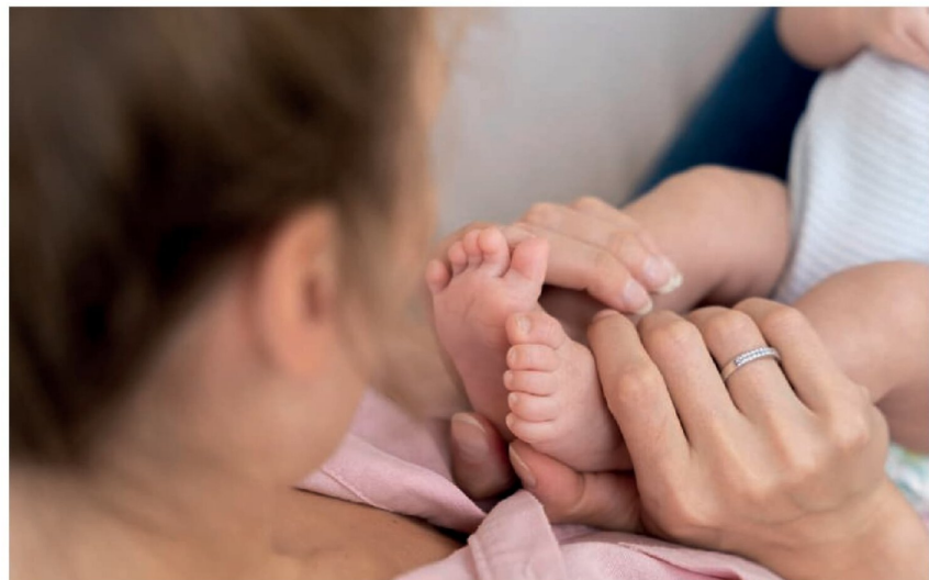
EN PROMEDIO, las mujeres chilenas están teniendo 1,2 hijos.