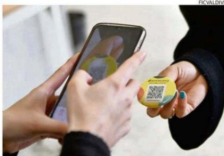
ESTE AÑO LAS CREDENCIALES FUERON CAMBIADAS POR CHAPITAS CON QR.

nes y estar considerados dentro de muchos otros eventos o hitos que internacionalmente se van a promover como lo que ofrece Chile en materia de cultura. El nuestro es un festival que ocurre en Valdivia, pero no