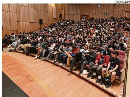
EL AULA MAGNA UACH FUE UNA DE LAS SALAS MÁS CONCURRIDAS.