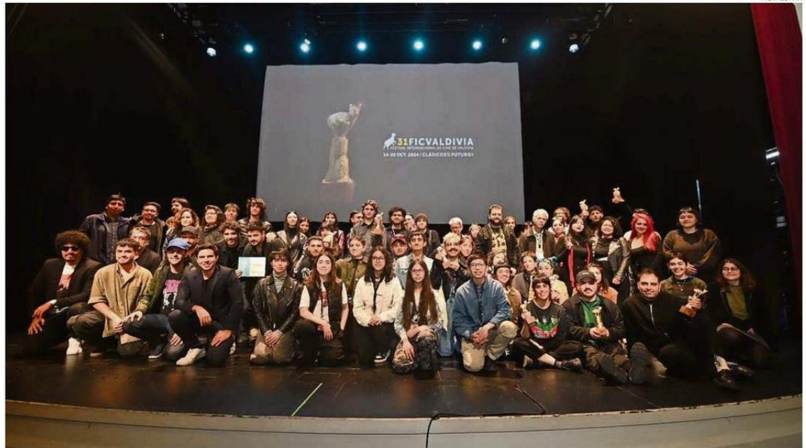
EL SÁBADO Y EN UN GESTO DE UNIÓN, LA PREMIACIÓN FINALIZÓ CON UNA GRAN FOTOGRAFÍA DE TODOS JUNTOS: JURADOS, GANADORES, INVITADOS Y QUIENES NO OBTUVIERON EL PUDÚ.

Además, la obtención de financiamiento por parte del Gobierno Regional de Los Ríos no fructificó como se esperaba. Aunque se mantuvo el apoyo de la Municipalidad de Valdivia y del Ministerio de las Culturas;