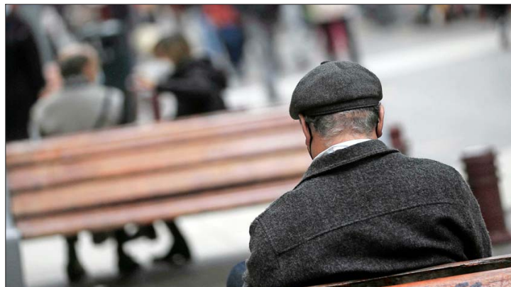
FENÓMENO.—Según estimaciones del INE, un 18% de la población del país es mayor de 60 años. Se espera que en 2050 el porcentaje llegue a un 30%.