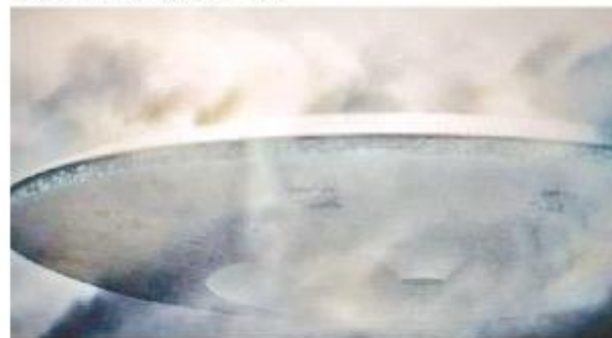
Ovni en Magallanes Antártico.