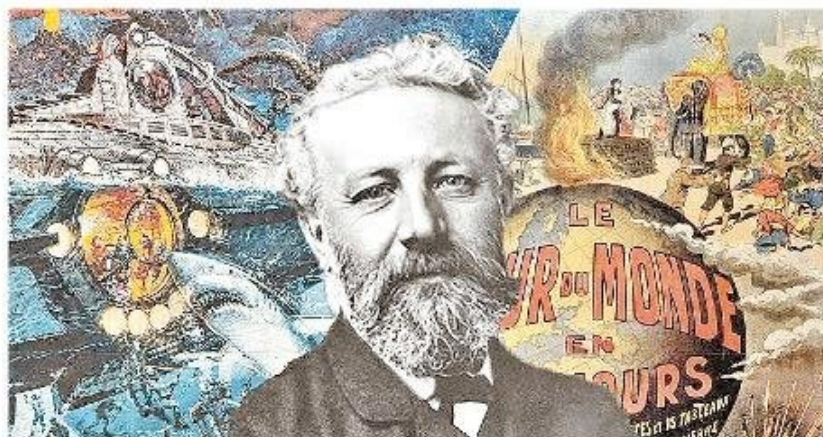
Julio Gabriel Verne.

El Albatros tenía características similares a lo que hoy son los helicópteros, razón por la que se le atribuye a Verne haber predicho la invención de estos vehículos aéreos. El primer vuelo libre del helicóptero o Gyroplane fue realizado el 13 de noviembre de 1907, que estaba sujeto por técnicos y sólo