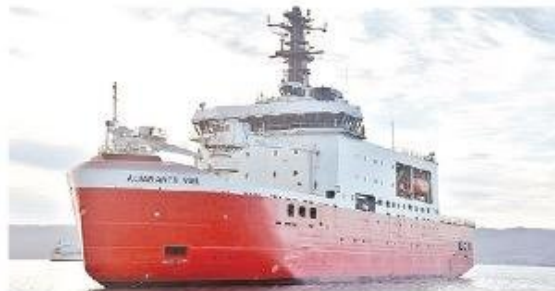
Rompehielos antártico Oscar Viel.