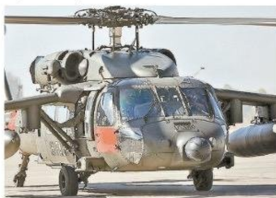
Helicóptero Black Hawk.