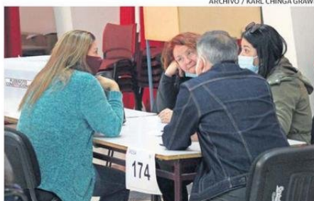
VOTACIONES SERÁN EN DOS DÍAS.

las 348 postulantes a concejales y concejales, los candidatos y candidatas para concejeros y consejeras regionales que suman un total de 121 en las tres provincias de la región, y los siete postulantes para ser gobernador regional de Atacama. Esta última elección se realiza por segunda vez en el país, y la autoridad (gobernador regional) debe ser electo con el 40% de los votos.