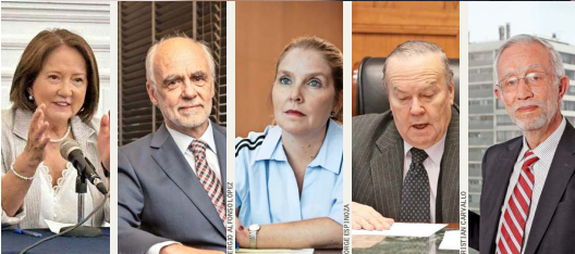
Soledad Alvear, exsenadora y exministra de Justicia.