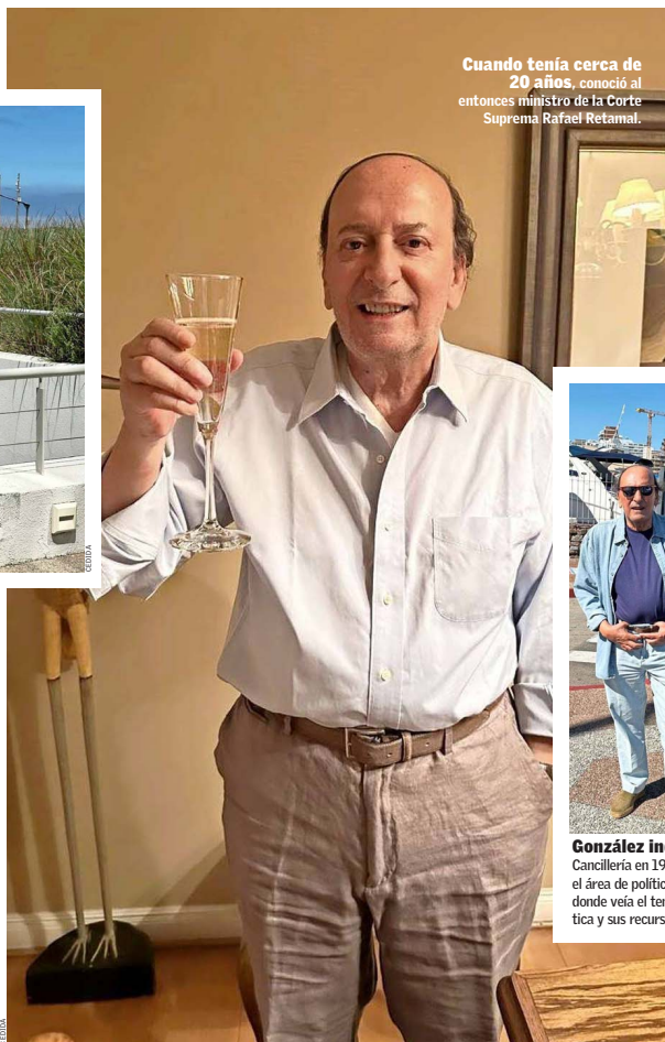
Cuando tenía cerca de 20 años, conoció al entonces ministro de la Corte Suprema Rafael Retamal.

Comenzó luego a frecuentar a Domingo Koksich, el ministro de la Corte Suprema que tenía matas pulgas con la prensa, con quien afirma que hizo gran amistad y también con su mujer, Malvina. Cuando murió, en 2006, lo llamó la familia y ahí estuvo él, apoyando al ministro Haroldo Brito —que era casi como hermano de Koksich y que en 2018 asumiría la presidencia de la Suprema—, que se encargó de hacer todos los trámites. Esa noche de su muerte, recuerda, llegaron a la casa del difunto en La Reina todos los ministros de la Corte; entre ellos, Milton Juica (presidente de la Suprema entre 2010 y 2012). Y él estaba en medio, y se hizo conocido en el círculo.