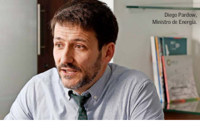
Diego Pardo, Ministro de Energía.

Ministro de Energía y críticas de la industria: "Veo cierta intransigencia en la manera en que han reaccionado" B 12