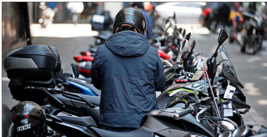
INCREMENTO. — El parque de motocicletas en Chile creció de 167.876 unidades en 2014 a 248.876 en 2023.

“Cuando partió la ley, se comenzó a fiscalizar el uso del casco, que fue muy bullado y Carabineros comenzó a poner