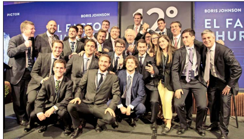
El equipo Picton junto al ex primer ministro británico después del almuerzo en el Hotel Ritz-Carlton.