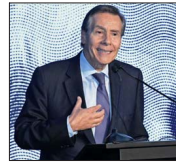
El ministro de Hacienda, Mario Marcel, durante su presentación en el almuerzo.