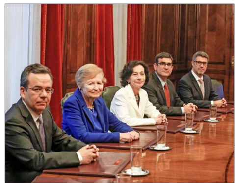
El Consejo del BC señaló que indicadores de alta frecuencia vinculados al consumo e inversión muestran relativa estabilidad en los últimos meses.