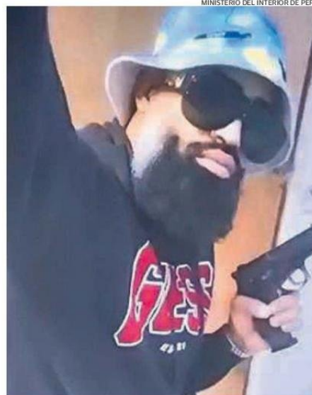
EL "BARBAS" SERÍA PARTE DEL BRAZO ARMADO DEL TREN DE ARAGUA.

Hasta el momento, la policía chilena ha detenido a seis