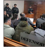
Hoy se resuelve si expolicías quedan en prisión preventiva.

REFORMA A NOMBRAMIENTOS JUDICIALES: CONSEJO PERMANENTE ES EVALUADO POSITIVAMENTE, PERO SE ADVIERTEN POSIBLES PROBLEMAS EN DEDICACIÓN EXCLUSIVA DE SUS INTEGRANTES | C1, C2 y C4 EDITORIAL | A 3