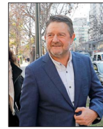
Gobierno regional suscribió contrato con fundación investigada.

REFORMA AL SISTEMA DE NOMBRAMIENTOS INGRESA HOY: MINISTERIO DE JUSTICIA PROpondrá CONSEJO PERMANENTE DE CINCO MIEMBROS Y MANTENER LOS CUPOS DE SUPREMOS "EXTERNOS" | C 2