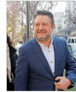
Gobierno regional suscribió contrato con fundación investigada.

REFORMA AL SISTEMA DE NOMBRAMIENTOS INGRESA HOY: MINISTERIO DE JUSTICIA PROPONDRÁ CONSEJO PERMANENTE DE CINCO MIEMBROS Y MANTENER LOS CUPOS DE SUPREMOS "EXTERNOS" | C 2