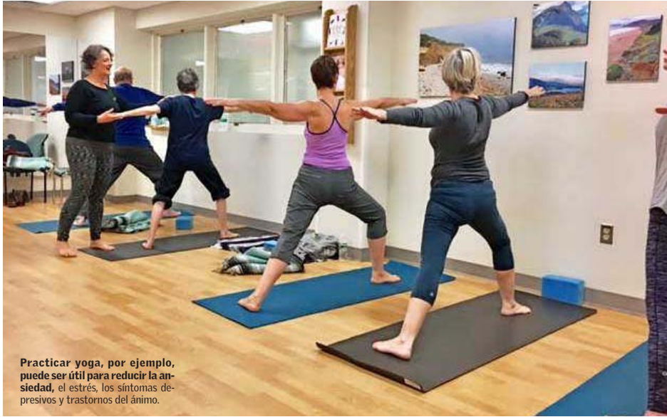
Practicar yoga, por ejemplo, puede ser útil para reducir la ansiedad, el estrés, los síntomas depresivos y trastornos del ánimo.

De hecho, precisa, se sabe que a veces "una terapia complementaria puede ayudar a disminuir la ansie-