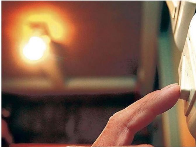
LETREROS LUMINOSOS DEBERÁN ESTAR PAGADOS ENTRE LA MEDIANOCHES Y LAS 7 DE LA MAÑANA.

Ramírez puntualizó que "la nueva norma establece límites de luminosidad, horarios máximos de funcionamiento de pantallas publicitarias o focos de recintos deportivos, además de promover la transición hacia el uso de luz cálida, sin que las personas pierdan la sensación de seguridad que da el alumbrado público".