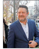
Gobierno regional suscribió contrato con fundación investigada.

REFORMA AL SISTEMA DE NOMBRAMIENTOS INGRESA HOY: MINISTERIO DE JUSTICIA PROpondrá CONSEJO PERMANENTE DE CINCO MIEMBROS Y MANTENER LOS CUPOS DE SUPREMOS "EXTERNOS" | C 2