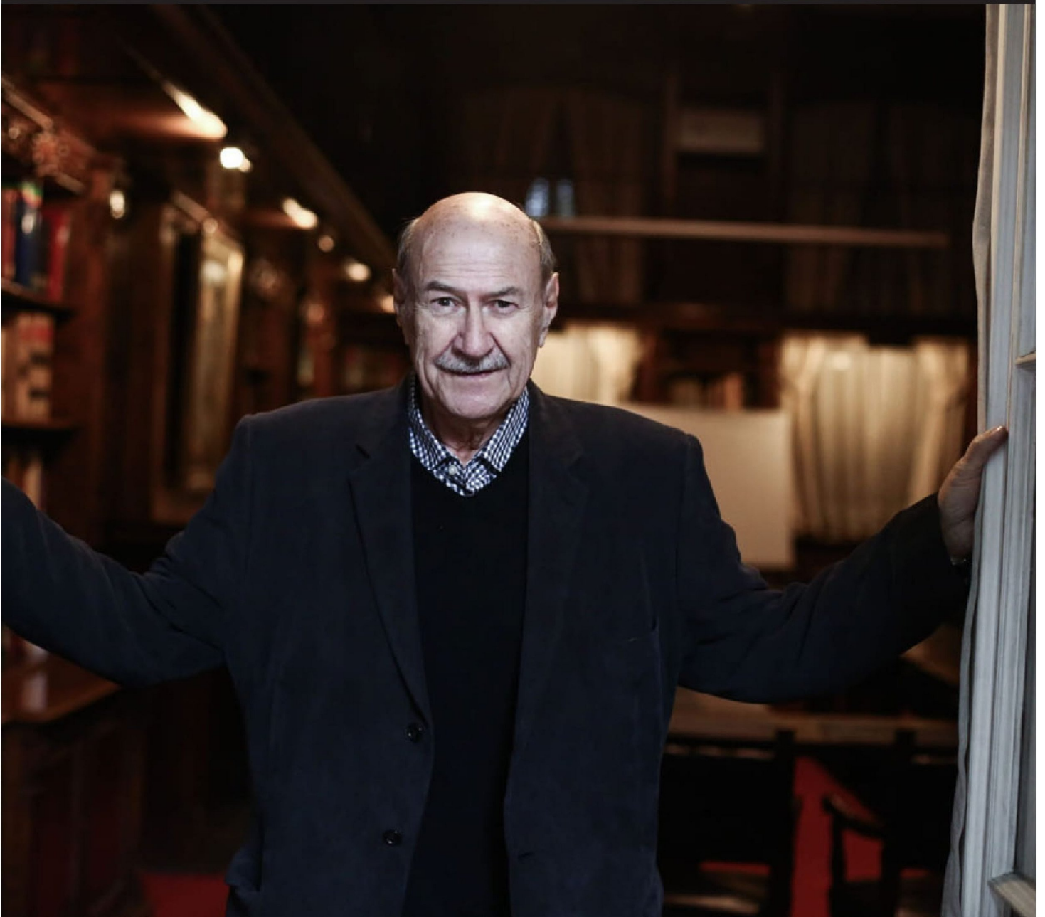
► Este martes en la mañana, a los 83 años, falleció el reconocido escritor chileno Antonio Skármeta.