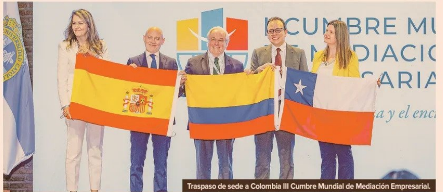
Traspaso de sede a Colombia III Cumbre Mundial de Mediación Empresarial.