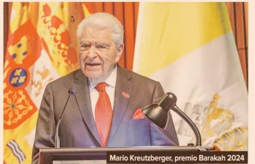
Mario Kreutzberger, premio Barakah 2024