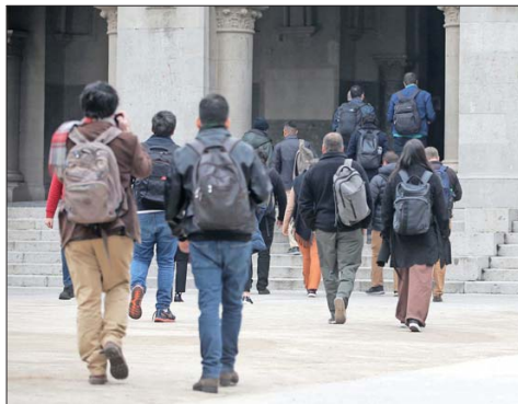
En un seminario realizado ayer por Clapes UC se analizó el impacto que tendrá en las instituciones de educación superior y en los futuros egresados el nuevo FES.

exdirector de Presupuestos en el segundo gobierno de Sebastián Piñera, estima que con el nuevo sistema un estudiante de Ingeniería Civil terminará “pagando el doble del costo original de la carrera, lo que en términos tributarios sería un impuesto a la renta progresivo, afectando solo a quienes financian sus estudios con el FES”.