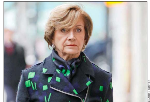
Evelyn Matthei (UDI), alcaldesa de Providencia

Además, algunos dirigentes apuntan a que la alcaldesa tiene un rol más dedicado a las vocerías diarias sobre temas contingentes a diferencia, dicen, de otras figuras que probablemente correrán a La Moneda por lo que advierten que eso puede generar desgaste, aunque destacan que