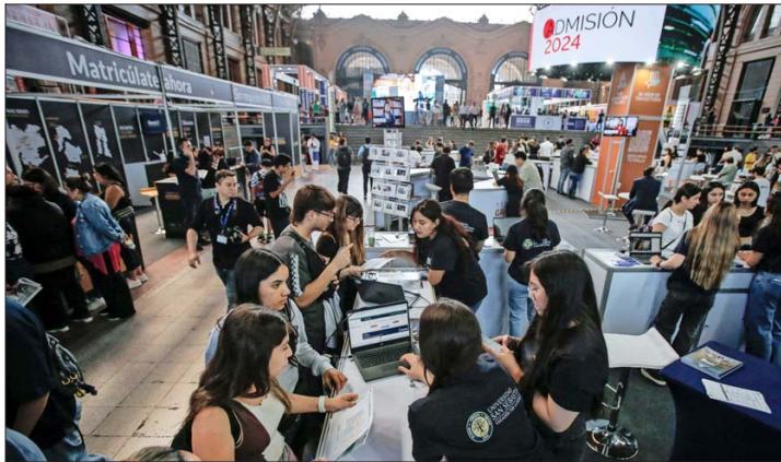
En el oficialismo creen que el proyecto que crea el FES y termina con el CAE será un complemento de la gratuidad para estudiantes de universidades e institutos.

Desde la oposición, el diputado Miguel Mellado (RN) es crítico: "Lamento que la propuesta sea engañosa porque, al modificar los gatillos, vuelven a mentirlas a los chilenos. La gratuidad universal es una quimera".