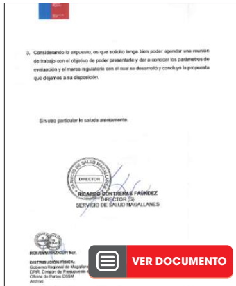
OFICIO 153 EN EL QUE SE INDICA EL TERRENO ELEGIDO POR LA COMISIÓN EVALUADORA.