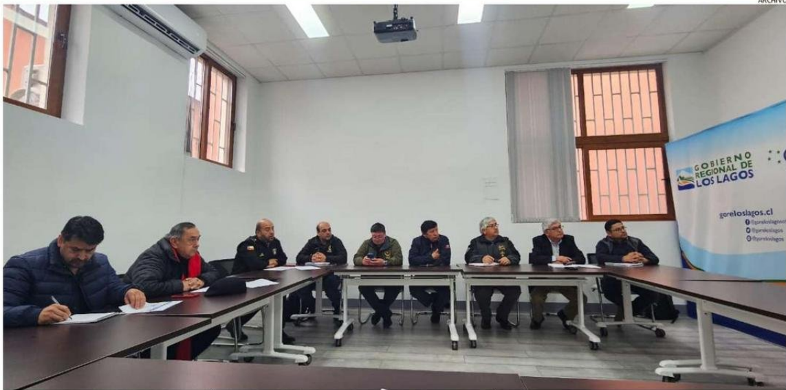
EL PRESIDENTE REGIONAL DE BOMBEROS SE REUNIÓ CON LOS SUPERINTENDENTES DE LA PROVINCIA, DONDE SE INFORMÓ EL TEMA.

El diputado recordó que, junto al superintendente Ro-