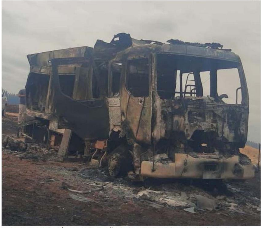
LA TARDE DEL 4 DE FEBRERO, EL MÓVIL DE LA PRIMERA COMPAÑÍA ESTABA EN UN INCENDIO FORESTAL CUANDO TERMINÓ DESTRUIDO.

Este fin de semana se llevará a cabo una reunión del directorio nacional, donde el presidente indicó que “voy a solicitar de forma definitiva la fecha de la orden de compra y la línea de financiamiento para este carro. La idea es poder con-