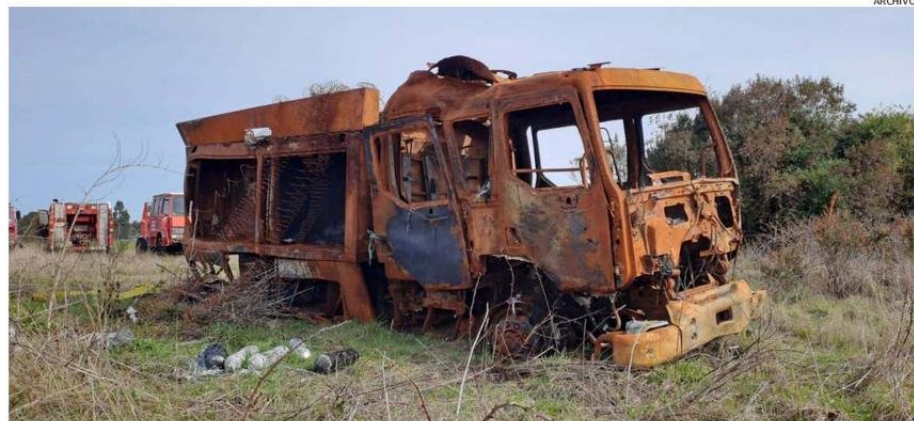
EL CARROBOMBA SINIESTRADO ESTÁ ACTUALMENTE EN EL CAMPO SUR DE BOMBEROS, EN LLANQUIHUE.