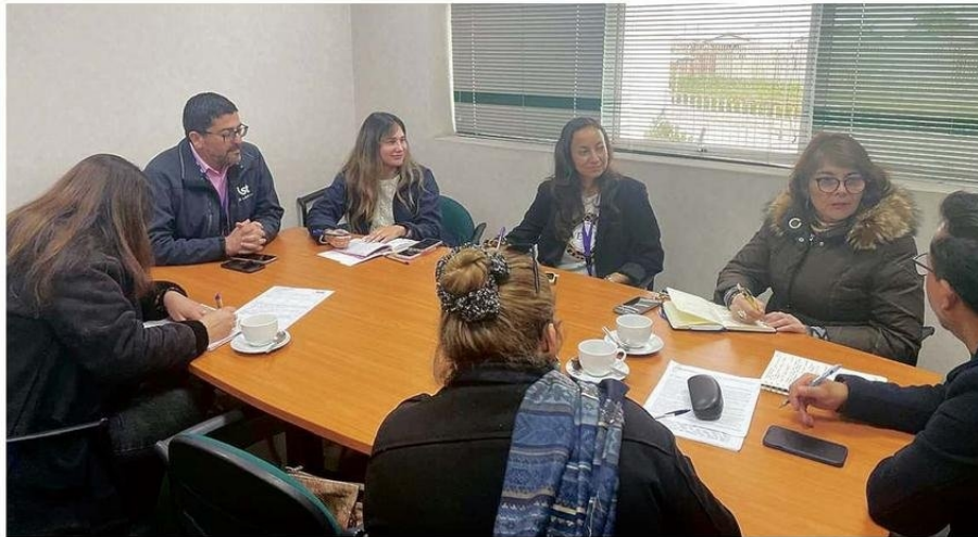
LA MESA TRIPARTITA ENTRE EL GREMIO DOCENTE, EL MUNICIPIO Y EL IST.

El Magisterio impulsa junto a Daem e IST talleres de salud mental y seguridad para docentes, como parte de la mesa tripartita en la comuna puerto.