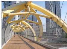
Puente de luz, Toronto.