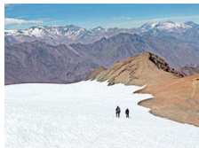
Camino a la cumbre de El Plomo.