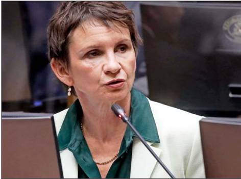
Carolina Tohá, ministra del Interior, es de las principales cartas presidenciales que intentará impulsar el PPD.