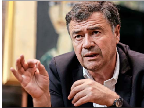
Esteban Valenzuela, ministro de Agricultura, es uno de los secretarios de Estado que saldrían en este cambio de gabinete.